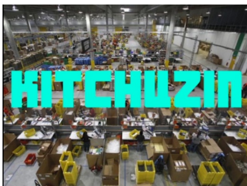
Elodie Paupe-Morales, Kitchuzin, aérobic industriel

Kitchuzin, aérobic industriel , performance participative, 15 min environ