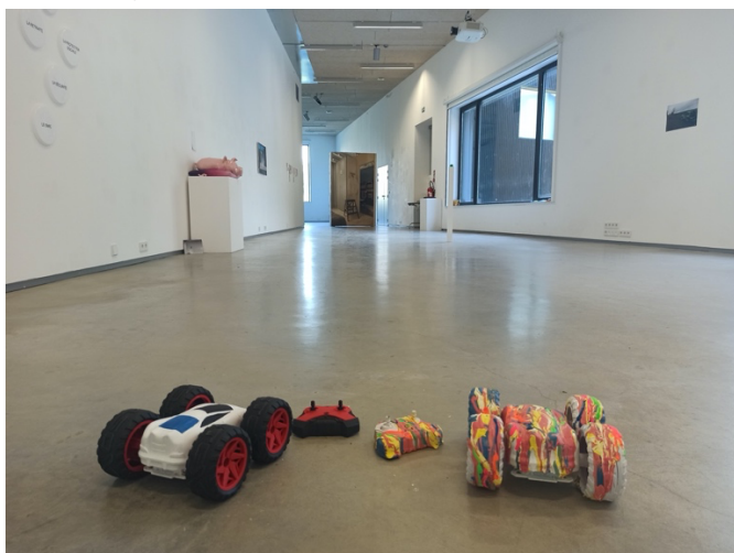
Margaux Moritz, Course spéculative , 2022

Course spéculative , série, acrylique sur 2 voitures télécommandées, dimensions variables, 2022