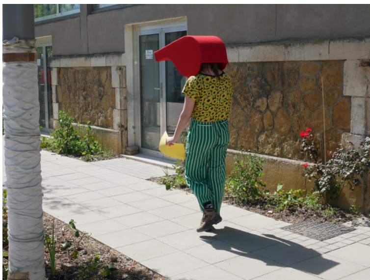
Juliette Hippert, Figures d'arbitres , 2022/2023

Figures d'arbitres , 3 sculptures à porter, cousues en feutre de couleur, carton gris, 3 tapis bleus, 3 protocoles d'activation, 100 × 300 × 50 cm, 2022-2023