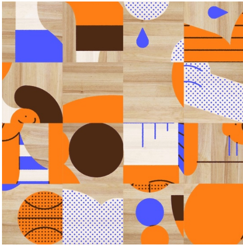
Pierre André, Sans titre , 2023

Sans titre , jeu de cartes, sérigraphie, puzzle, sérigraphie sur bois, normographes, gravure laser sur plastique, 2023