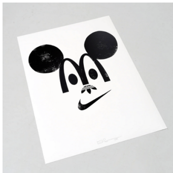
Eike König (Hort), Happy branding , 2023

Happy branding 50 × 70 , sérigraphie manuelle sur papier épais à bord frangé Zerkall, série de 50, signées et numérotées au crayon, 50 × 70 cm, 2023