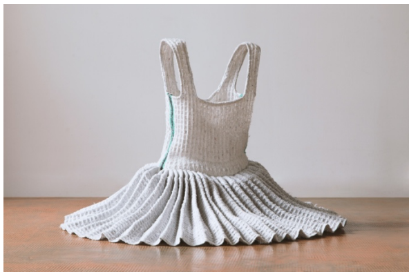
Estelle Chrétien, Danse domestique , 2020

Danse domestique , serpillières, 60 × 90 × 90 cm, 2020